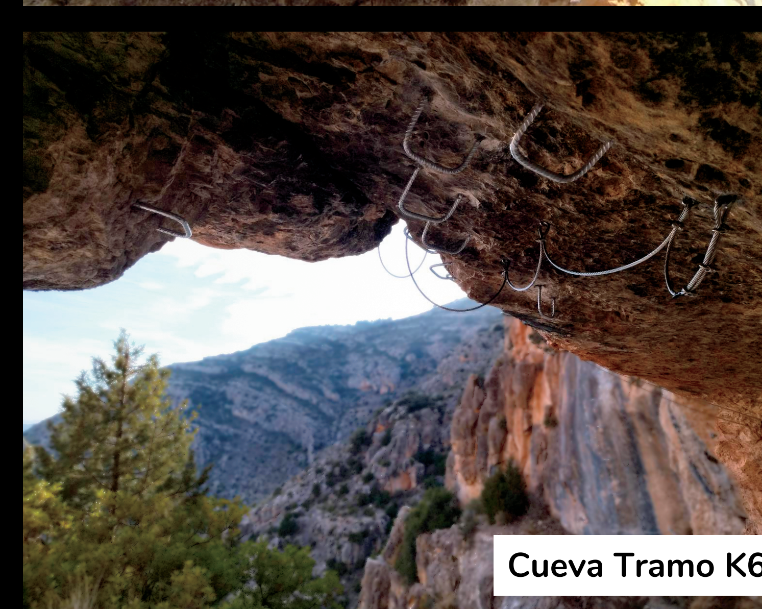
Cueva Tramo K6